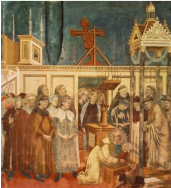
Fig. 15: Assisi, basilica di San Francesco, Giotto

1475 e il 1481, all'epoca di papa Sisto IV della Rovere, un francescano così come l'arcivescovo Serafino da Squillace.