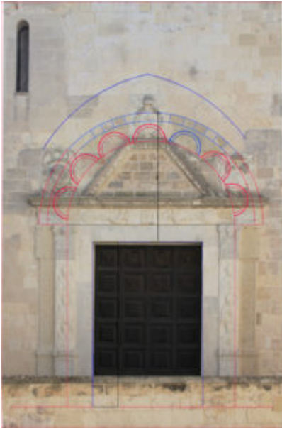
Fig. 11: Otranto, cattedrale, porta settentrionale, in blu evidenziati segni di muratura e tessitura esistente; in rosso e blu la ricostruzione del portale precedente quello del 1582.