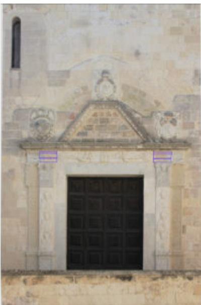
Fig. 10: Otranto, cattedrale, porta settentrionale, in blu evidenziati i tratti marmorei dell'architrave a fasce nella probabile posizione originaria prima dell'ampliamento del