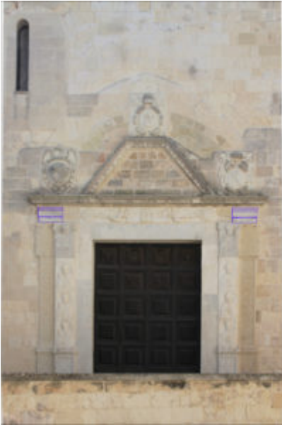
Fig. 9: Otranto, cattedrale, porta settentrionale, in blu evidenziati i tratti marmorei dell'architrave a fasce nella posizione attuale.