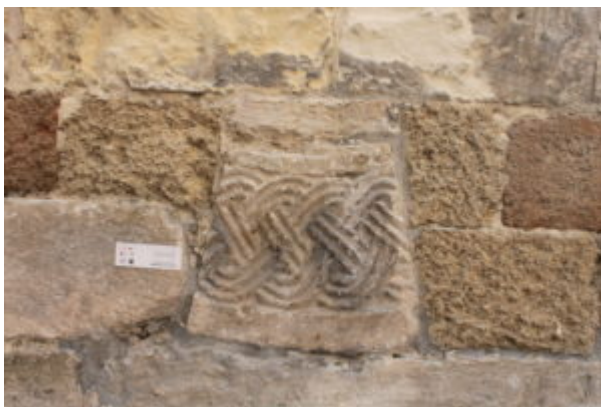
Fig. 14: Otranto, cattedrale, prospetto settentrionale, frammento lapideo.

elementi tali da indurre a pensare che questo elemento architettonico non fosse in una delle ghiera componenti quella che potrebbe essere stata anche una porta. Probabilmente quella che, dentro la cattedrale, dalla scala sinistra consente l'accesso alla cripta; qui, infatti, i pochi conci (manca più della metà dell'arco e lo stipite destro) ancora in loco presentano la medesima decorazione a intreccio e struttura rilevabile nel frammento murato. Nell'altra porta, quella della scala a destra, simmetrica alla precedente, gli stipiti e l'arco sono ancora in situ.