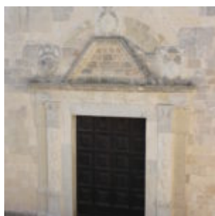
Fig. 1: Cattedrale di Otranto, facciata settentrionale, portale.

casi, di non trascrivere i brani dell'autrice del contributo analizzato limitandosi così a indicare più semplicemente la pagina del saggio medesimo. Nelle trascrizioni (epigrafi, documenti), redatte e verificate con Enrico Spedicato, le abbreviazioni sono state sciolte inserendole in minuscolo, il resto del testo si è trascritto invece tutto in maiuscolo; per semplicità di lettura, infine, alcuni dati storici è stato necessario ripeterli in più parti dell'analisi. Detto questo non rimane che concentrarci su quella che è la parte principale del saggio, quella dedicata all'analisi storico-artistica del portale settentrionale della cattedrale di Otranto (fig. 1).